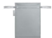
FUNDA DE TRANSPORTE Guarda cómodamente el dispositivo para que cuides siempre tu piel