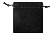
旅行袋 方便随时存取设备。