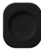
底座 安置并保护您的FAQ™设备。