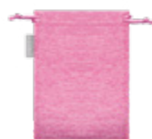
旅行袋 在家里、工作中或外出时方便地存放眼部护理设备。