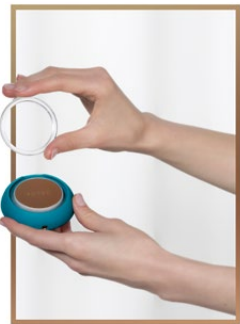
1. 取下 UFO™ 3 go 上的塑料圆环