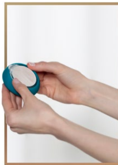
3. 将印有FOREO logo 的塑料圆环朝上并夹在面膜上以固定面