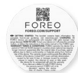
基本操作手册 帮助您深入了解设备， 解决使用过程中遇到的困难。