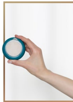
4. 在APP内选择对应面膜护理程序