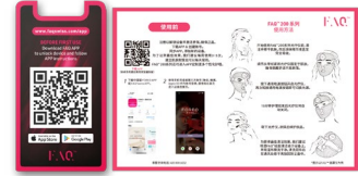
快速操作指南 帮助您快速了解设备, 上手使用。