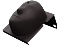
面罩仪陈列架 放置、保护您的面罩仪。