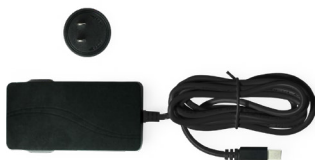
电源适配器 随时随地为您的设备供电。