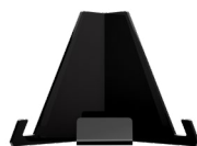
大排灯支架 为设备提供稳定支撑。