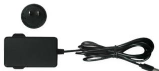
电源适配器 随时随地为您的设备供电。