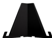
大排灯支架 为设备提供稳定支撑。