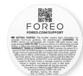
基本操作手册 帮助您深入了解设备，解决使用过程中遇到的困难。