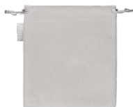
旅行袋 方便外出携带。