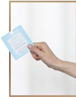
2. 取出 UFO™ 强效活力面膜