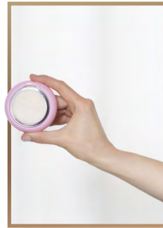
4. 在APP内选择对应面膜护理程序