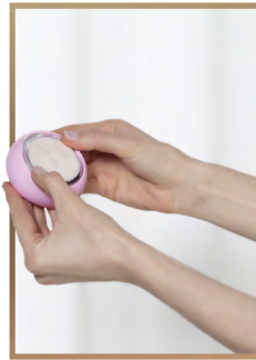
3. 将印有FOREO logo 的塑料圆环朝上并夹在面膜上以固定面膜