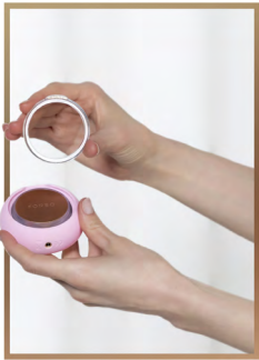
1. 取下 UFO™ 3 mini 上的塑料圆环